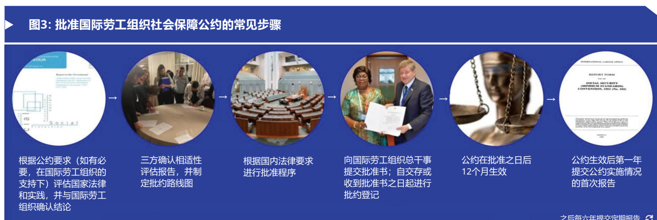
图3: 批准国际劳工组织社会保障公约的常见步骤

国际劳工组织还向进入批约流程的国家提供在国家议会程序中通常需要用到的公约真实副本。在国家层面完成批准程序后, 为了正式登记并在12个月后产生效力, 公约批准书必须送交国际劳工组织总干事。就第102号公约而言, 送交国际劳工组织总干事的批准书需要具体说明在批准时接受公约九个部分中(至少)哪三个部分。各国今后可随时扩大公约批准内容的范围。