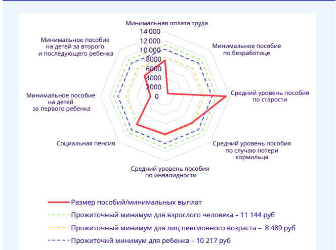
Рис. 2. Размеры пособий в России в сравнении с минимальным прожиточным уровнем (в рублях), 2017 г.