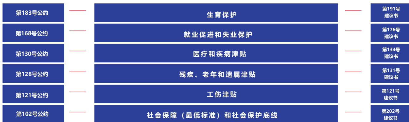
► 图2：国际劳工组织现行有效的社会保障标准

基于第102号公约，国际劳工组织随后通过了五项专题公约，在受保护人和保障水平方面确立了更高的标准（见图2）：