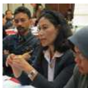
ກອງປະຊຸມຄົ້ນຄວ້າ ທີ່ບ້ານກອກ ແລະ ຈາກາຕາ