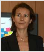
欧尚“编织我们的未来”基金会项目经理